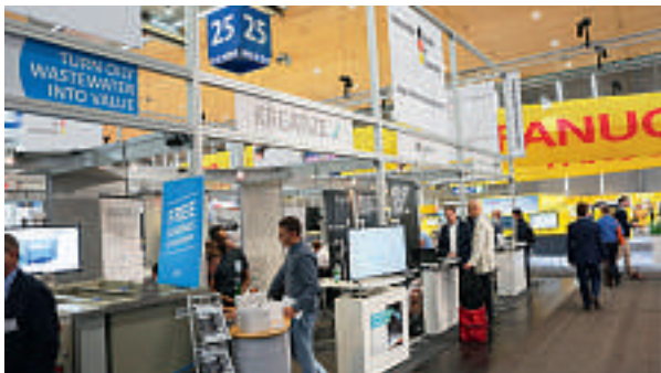
Gemeinschaftsstand: Start-up-Firmen können sich auf der Metav in Düsseldorf unkompliziert präsentieren.

Erstmals wird es zur Messe Metav 2018 (20. bis 24. Februar, DE-Düsseldorf) einen Gemeinschaftsstand für deutsche Start-up-Unternehmen geben. Ziel ist es, die Firmen bei der Vermarktung ihrer neuen Produkte oder verfahrenstechnischen Neuentwicklungen umfassend zu unterstützen und insbesondere den Export zu fördern. Rund 2,5 Mio. Euro lässt sich das Bundeswirtschaftsministerium dieses Programm jährlich kosten. metav.de